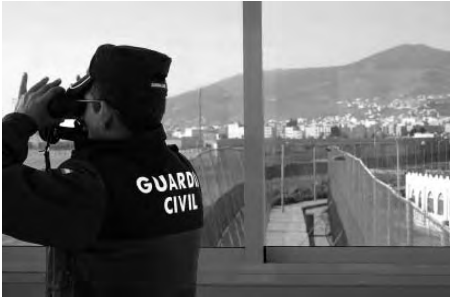
Frontera de Melilla.