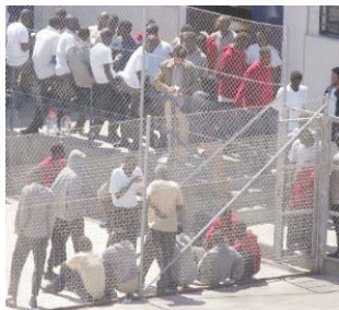
Personas detenidas y privadas de libertad por no haber cometido ningún delito