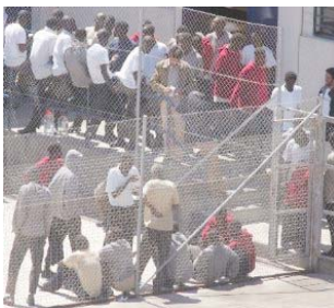
Persones detingudes i privades de llibertat per no haver comès cap delictes.

■ Falta de transparència. El secretisme que envolta els Centres d'Internament, estratègicament aïllats, propicia aquestes vulneracions. Malgrat que l'internament el dicta un jutge, aquest no fa cap seguiment del procés.