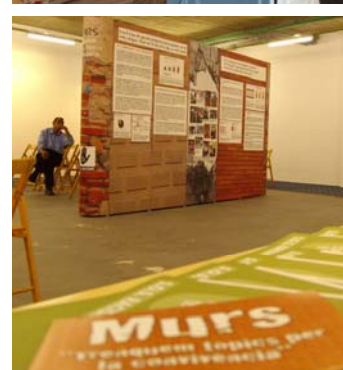
L'exposició a diferents espais.