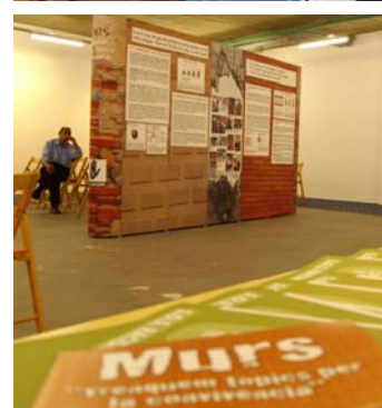
L'exposició a diferents espais.