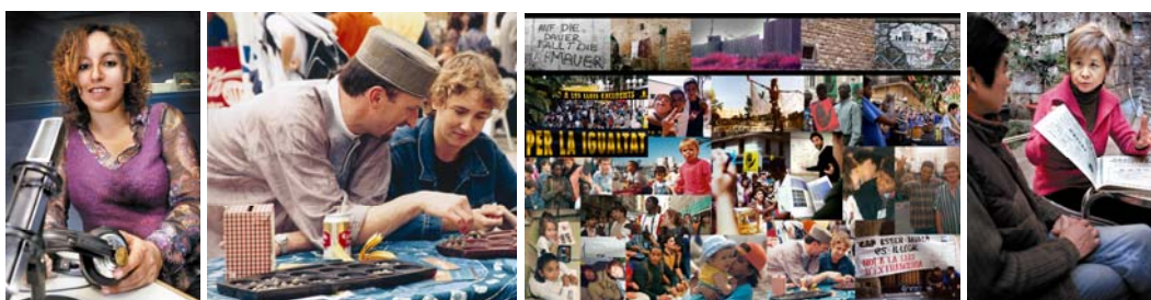
Algunes de les imatges que formen l'exposició.

Des de SOS Racisme proposem una acció conjunta a l'administració, les entitats i la xarxa social en general per despertar consciències davant la diversitat de Catalunya i la seva realitat variable i trencar els tòpics que tant de mal fan a la convivència.